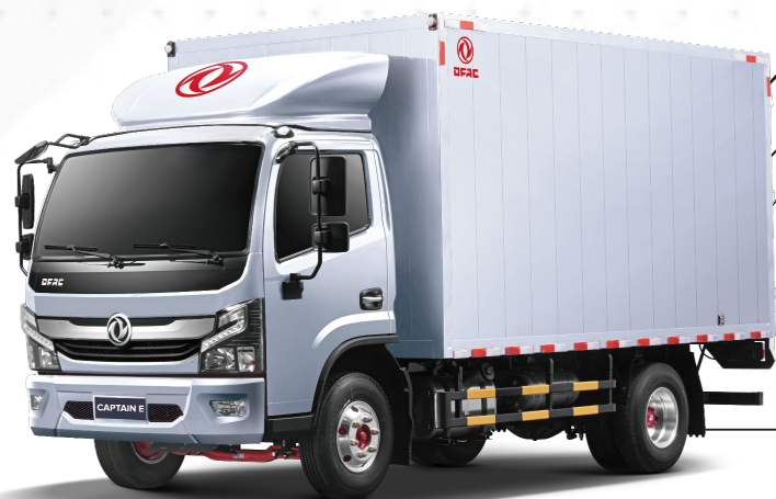
Año modelo 2026*